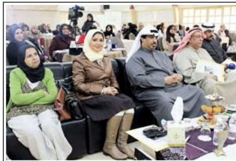
خلود المفيدة متوسطة الحضور